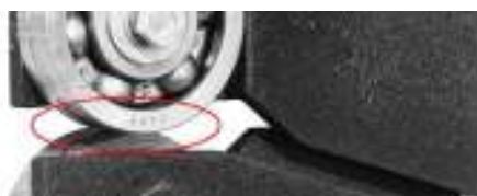
Рис 4. Зазор между ножами