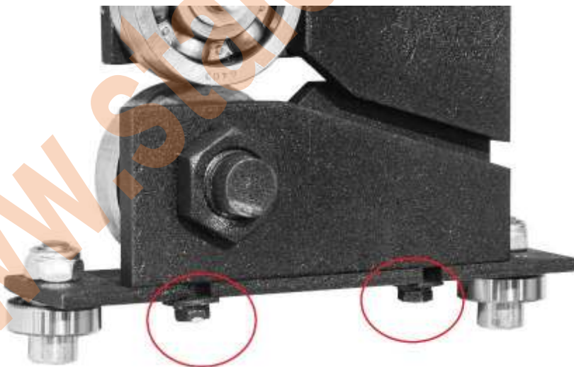
Рис 1. Регулировка Право-Лево

При уводе отрезной машинки во время отрезки вправо (на станок) необходимо: