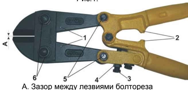
А. Зазор между лезвиями болтореза