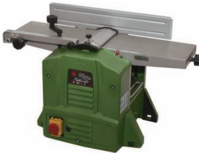
СТАНОК СТРОГАЛЬНО - РЕЙСМУСОВЫЙ